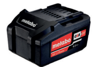
18V 4 AH