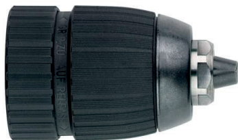
36518 / 36520