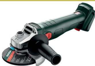
W 18 7-125