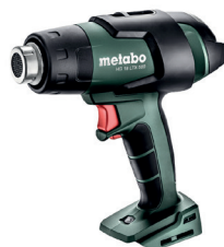
HG 18 LTX 500