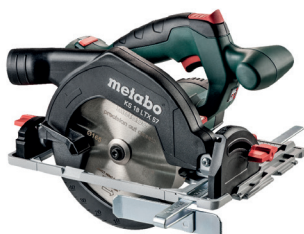
CARCASA KS 18 LTX 57