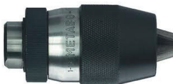
36342 / 36343 / 36362 / 36363