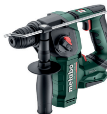
BH 18 LTX BL 16