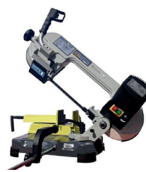
BF 120 SCV