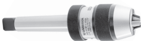
3-16 SOLIDARIO MK2 / MK3 / MK4