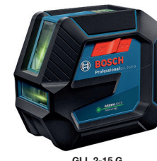
GLL 2-15 G