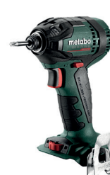
SSD 18 LTX