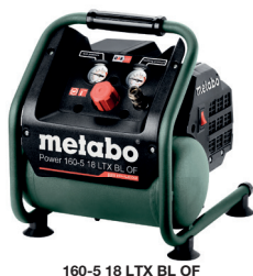
160-5 18 LTX BL OF