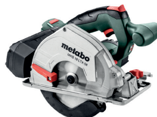
CARCASA MKS 18 LTX 58