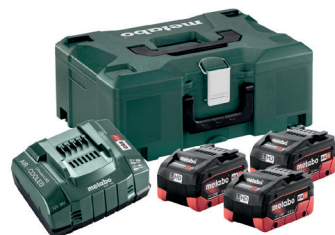
PACK LIHD 5,5 AH