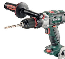
CARCASA SB 18 LTX BLI