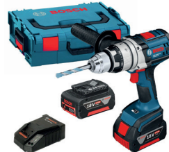
GSB 18 VE 2LI