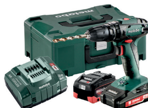
SB 18 1,3 AH 2 BIAS