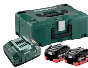
PACK LIHD 8 AH