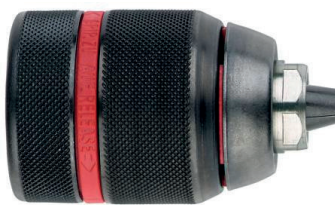
36619 / 36620