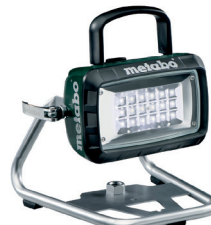
BSA 14.4 18 LED