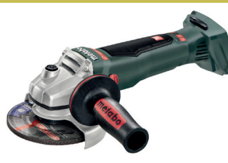
W 18 L9 125