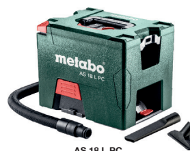
AS 18 L PC