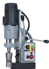
ECO 50 T