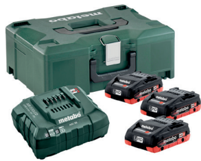
PACK LIHD 4 AH