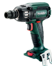
SSW 18 LTX 400