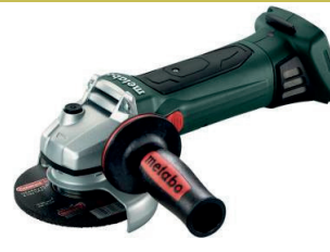
WB 18 LTX BL11