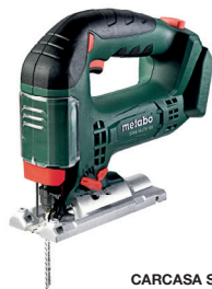
CARCASA STAB 18 LTX