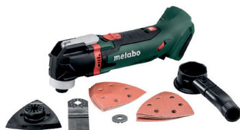
MT 18 LTX