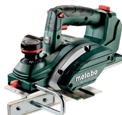
HO 18 LTX