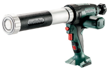
KPA 18 LTX 400