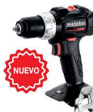
CARCASA SB 18 LT BL SE