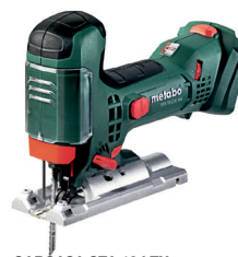
CARCASA STA 18 LTX