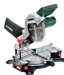
KS 216 M