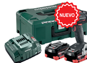
SB 18 LT BL SE 2 BIAS