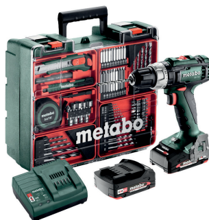
SET SB 18 L