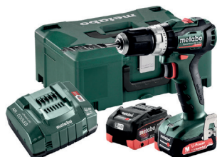
SB 12 BL