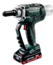
NP 18 LTX BL 5.0