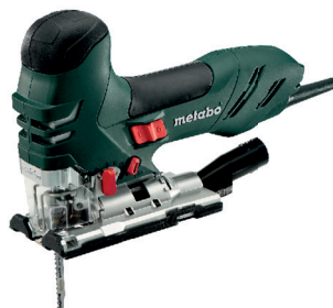
STEB 140 PLUS