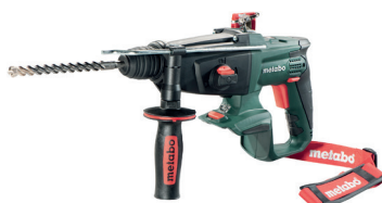
CARCASA KHA 18 LTX