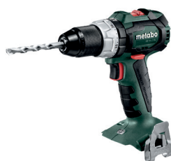
CARCASA SB 18 LT BL