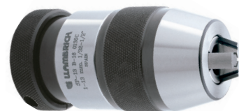
SP 1-13 B16 / SP 3-16 B16 / SP 3-16 B18