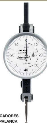
INDICADORES DE PALANCA