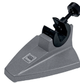
SOPORTE PARA MICRÓMETRO