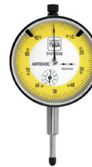
COMPARADOR SIN PROTECCIÓN