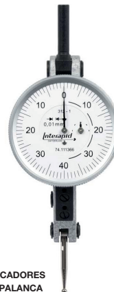
INDICADORES DE PALANCA