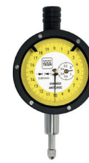
COMPARADOR CON PROTECCIÓN